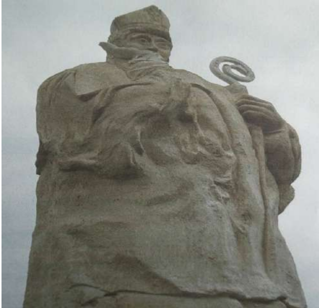
Statue actuelle restaurée en 2005 à l'initiative des Amis du Buis et des Baronniees

Il est dès lors probable que la chapelle de Saint-Trophime du Buis ait quelque chose à voir avec ces événements car ils eurent tous deux un grand retentissement dans toute la Provence de cette époque, étant donnée l'importance de la ville d'Arles, considérée comme une capitale. Ils eurent entre autres pour conséquence de tirer de l'oubli et de ramener à l'actualité le vocable de Saint-Trophime, à qui peu d'édifices religieux étaient alors dédiés.