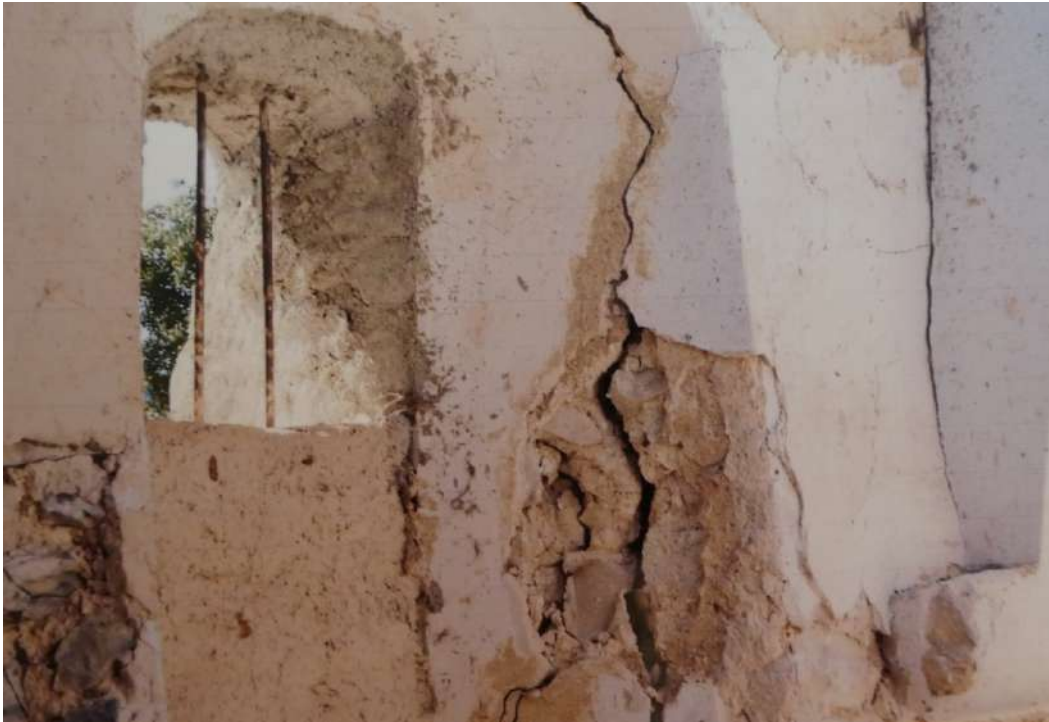
Intérieur de la chapelle avant les travaux de restauration