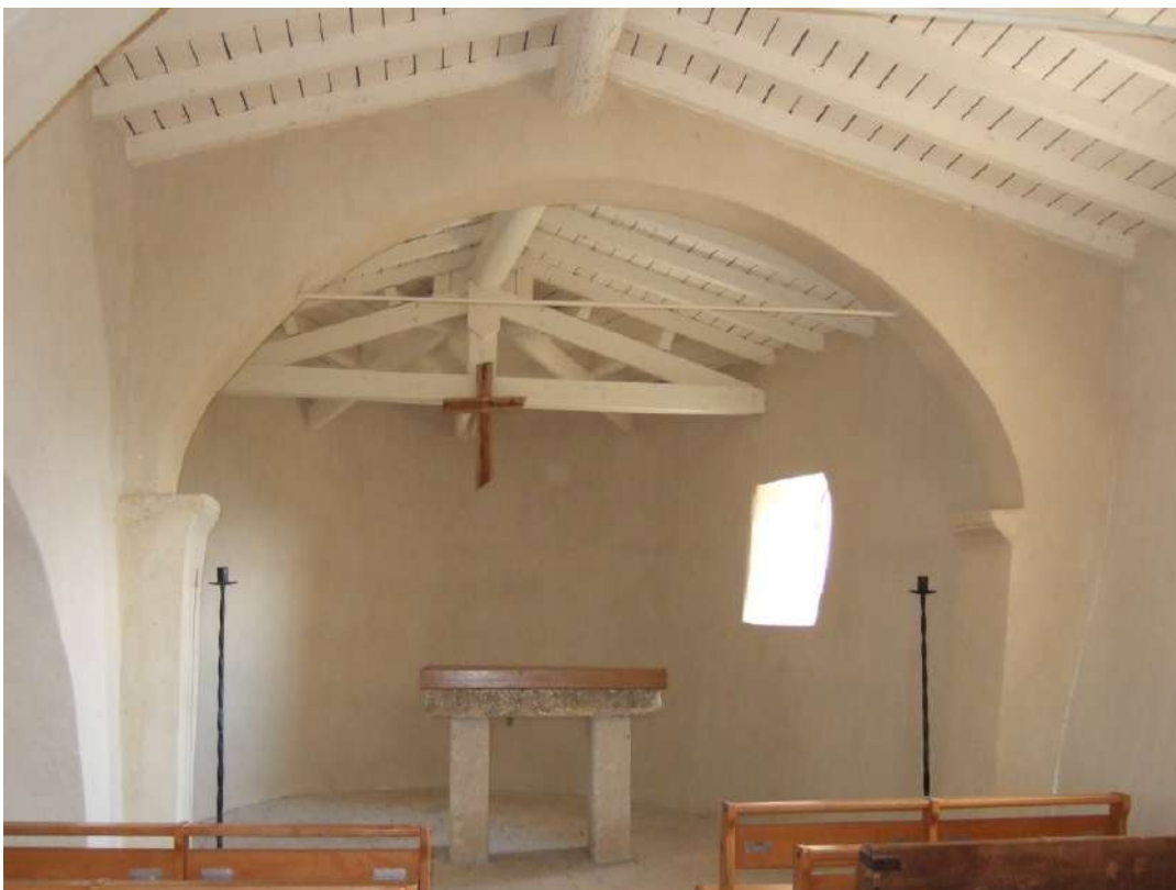
Ci-dessous : Intérieur après restauration