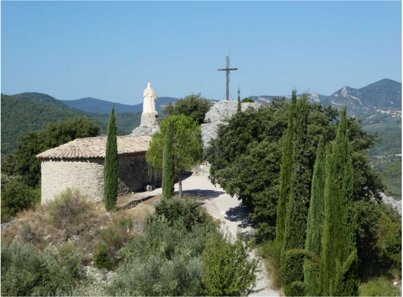
La chapelle Saint-Trophime

La chapelle Saint-Trophime se situe à environ 3 km du Buis, en prenant la route du Saint Julien en direction de La Bouscaude sur l'ancienne route de Plaisians.