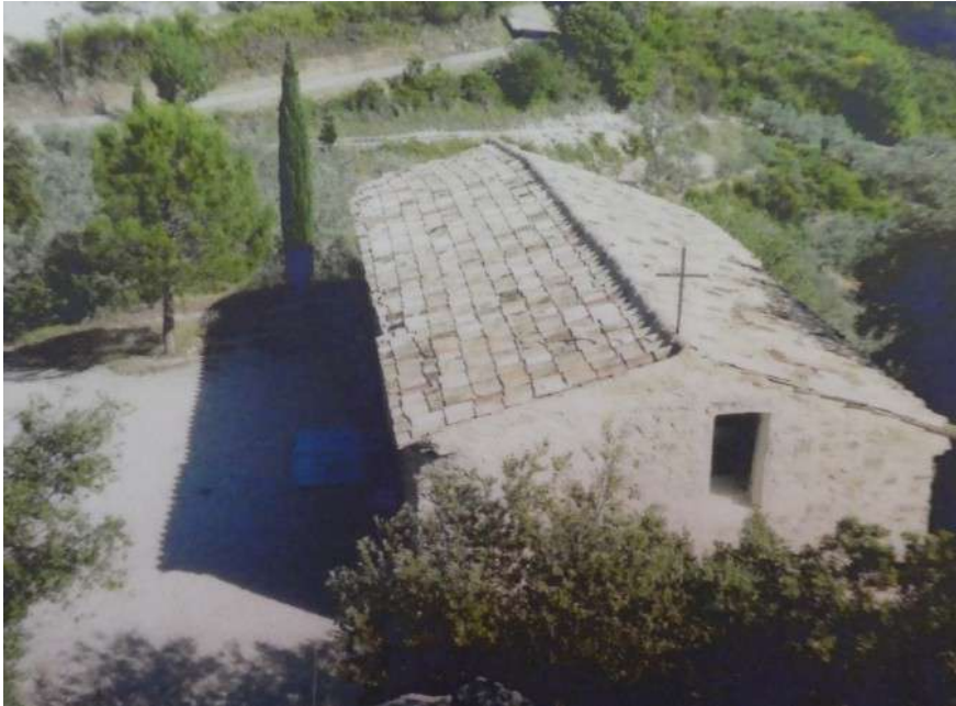
Photo de la chapelle depuis le promontoire de la statue