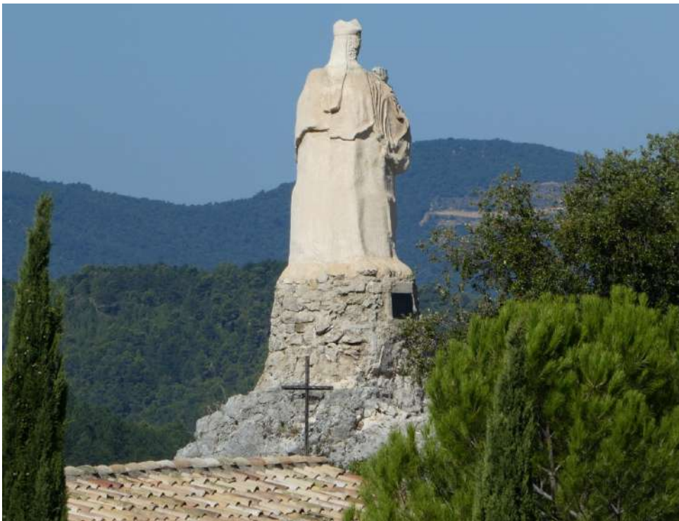
Statue restaurée en 2005, implantée sur un éperon rocheux dominant en à- pic le confluent des vallées de l'Ouvèze et du rieu de Laval, à l'entrée sud de Buis-les-Baronnies par la route départementale 5.