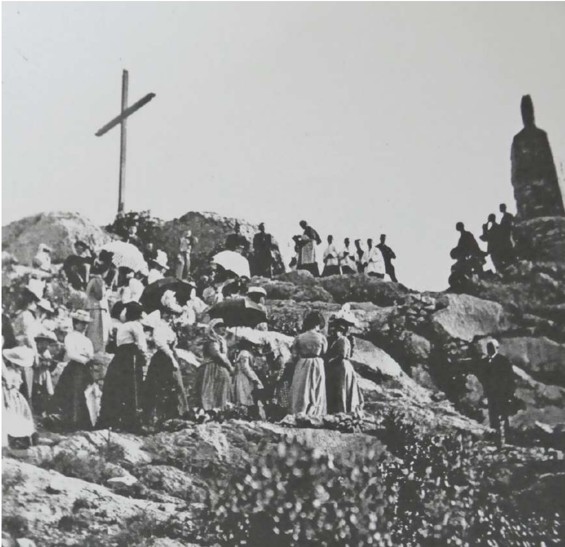
Photo prise vers 1930, lors d'un p lerinage de Pentec te, sur laquelle nous pouvons voir la premi re statue de Saint-Trophime, r alis e sur une structure en bois d'olivier. Expos e aux intemp ries, rong e par l' rosion, elle a  t  enti rement restaur e en 2005.

Enqu te et Photos : Fr. Nio pour APB (Amis du Patrimoine des Baronniees)