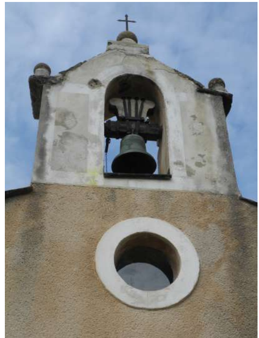
détails de la façade sud et des contreforts

----- Les Amis du Patrimoine des Baronniees -----