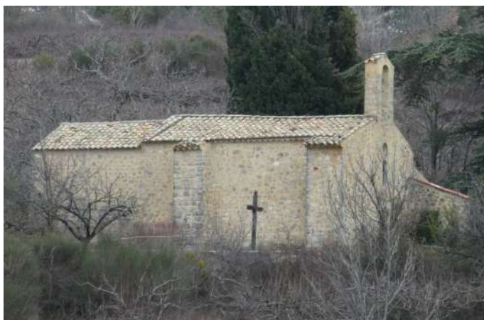
Vue de la chapelle des Sias depuis la D 154 (prise au zoom).

Visible depuis la route D154 entre Buis-les-Baronnies et le Poët-en-Percip, au-delà de la Roche-sur-le Buis, et du hameau des Sias, la chapelle Notre Dame est située 200 m au nord du hameau des Preyrauds. Cette petite chapelle typique se dresse dans une prairie au pied de la falaise de Banne. Elle est accolée à un petit cimetière qui réunit, sur un carré d'environ 15m de côté, un cyprès, un pin, un lilas et un noyer.