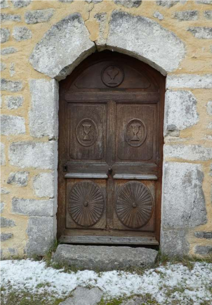
Porte d'entrée de la chapelle des Sias, dite « des Sept Douleurs »