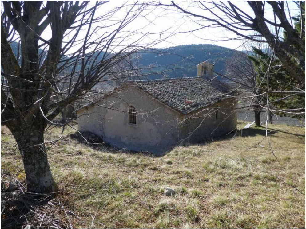
La chapelle vue de l'arrière. Des inhumations avaient jadis lieu dans un petit cimetière, au milieu des tilleuls. Ne subsiste aucune sépulture visible de nos jours.