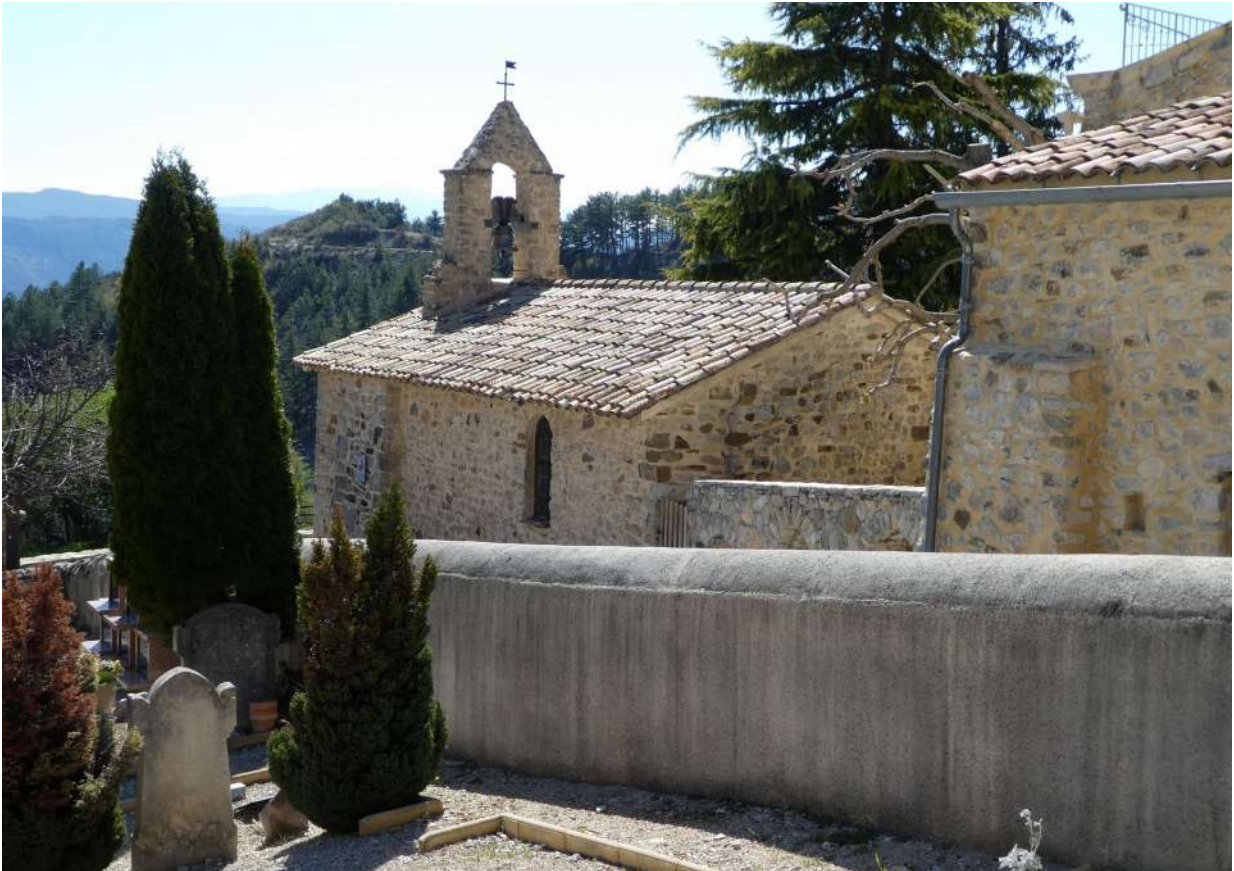
Vue de l'arrière de la chapelle, séparée du cimetière par une ruelle étroite

La chapelle se situe dans le petit hameau de Tarendol, à environ 1 km du village de Bellecombe (voir carte p.4).