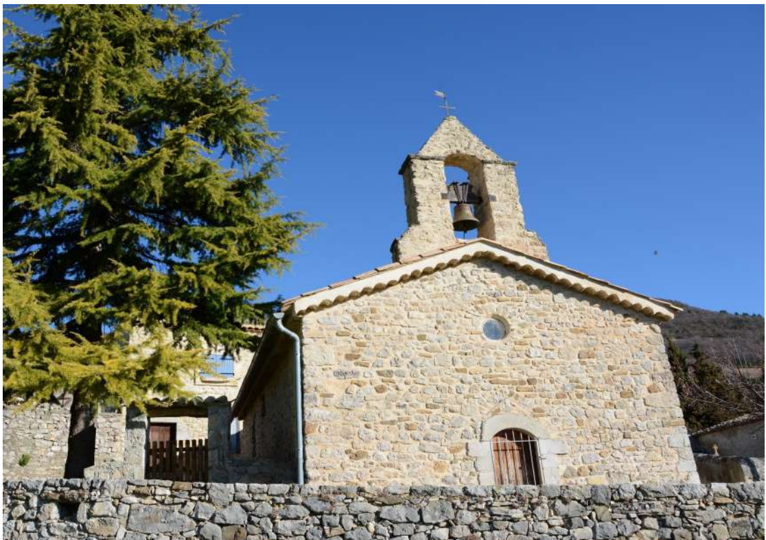
Vue de la chapelle de tarendol depuis le sud

Dimensions de la chapelle: longueur intérieure: 10,60m / largeur intérieure 6,40 m