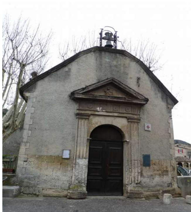
Porte d'entrée de la chapelle dite « du Pont » vue de face

Ce demi-cylindre en encorbellement sur le rebord du pont franchissant l'Ouvèze supporté par un cul-de-lampe fait face à la tour de l'Horloge qui marque une des entrées fortifiées de l'ancien village médiéval.