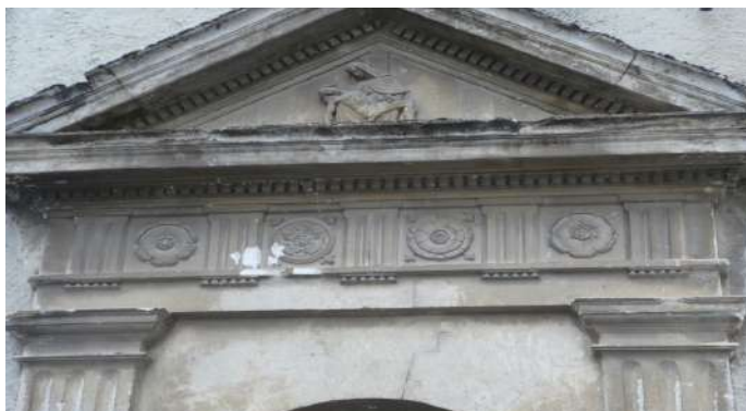
Chapiteau de la porte d'entrée

L'édifice, enfin restauré, a pu être soumis à l'agrément des Bâtiments de France qui l'inscrivirent à l'inventaire supplémentaire des monuments historiques le 30 mars 1978.