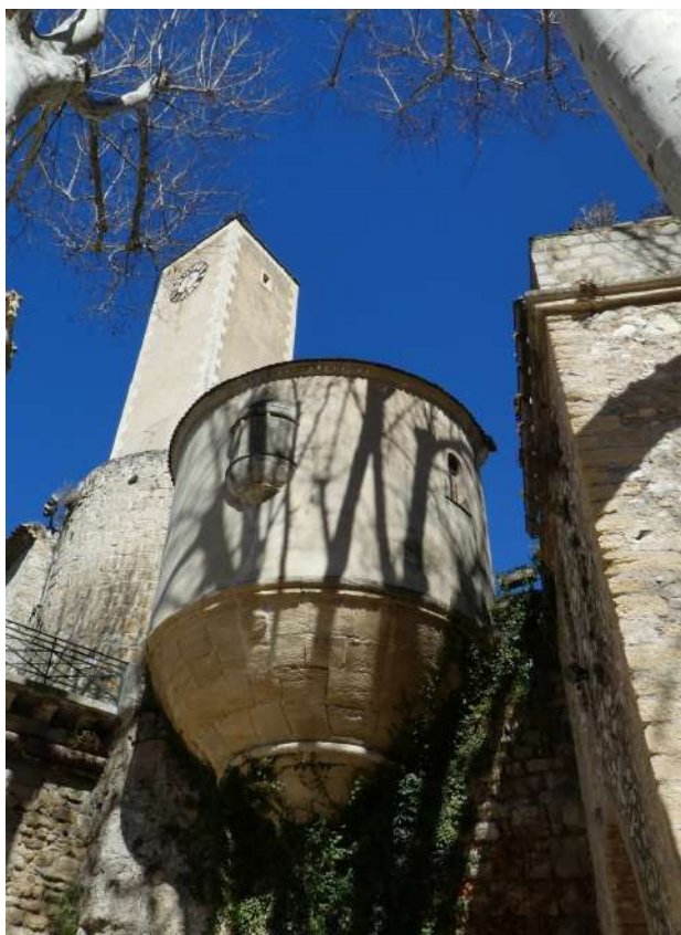
Photo prise du lit de l'Ouvèze, en contrebas de la chapelle