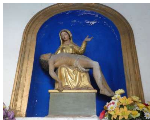
A l'intérieur de la chapelle, on trouve une piéta naïve en bois polychrome.