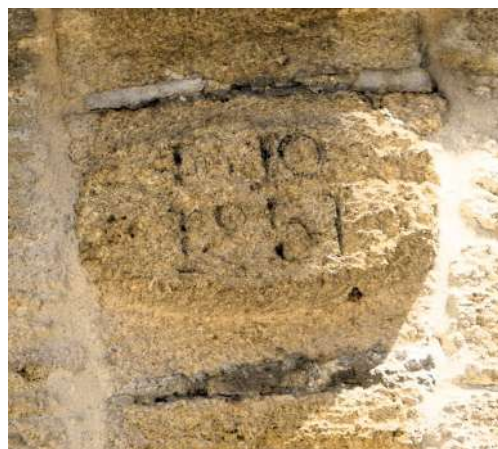
Le cartouche porte la date de sa construction:1851.