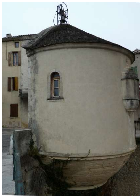
Arrière de la chapelle photographié du pont dominant le lit de l'Ouvèze