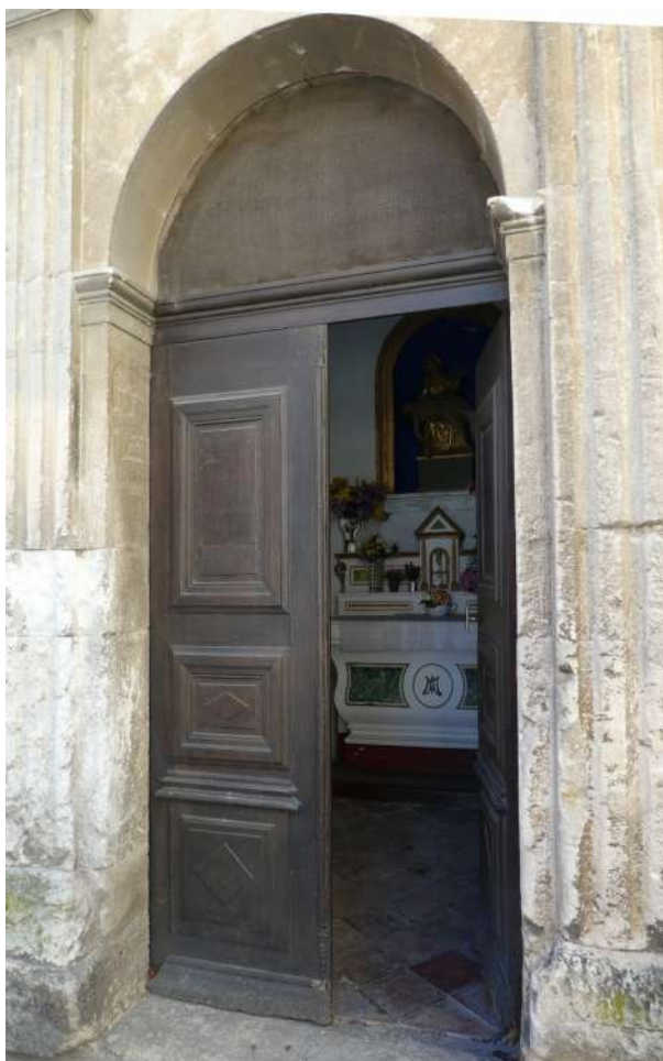
Aperçu de l'autel par la porte entrouverte

Pour la façade, on choisit la pierre de Saint-Paul-Trois-Châteaux: facile à travailler, elle permettait des motifs de styles qui plaisaient à l'époque.