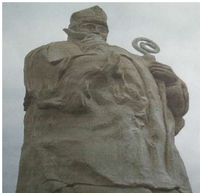
Statue actuelle restaurée en 2005 à l'initiative des Amis du Buis et des Baronnie

Il est dès lors probable que la chapelle de Saint-Trophime du Buis ait quelque chose à voir avec ces événements car ils eurent tous deux un grand retentissement dans toute la Provence de cette époque, étant donnée l'importance de la ville d'Arles, considérée comme une capitale. Ils eurent entre autres pour conséquence de tirer de l'oubli et de ramener à l'actualité le vocable de Saint-Trophime, à qui peu d'édifices religieux étaient alors dédiés.