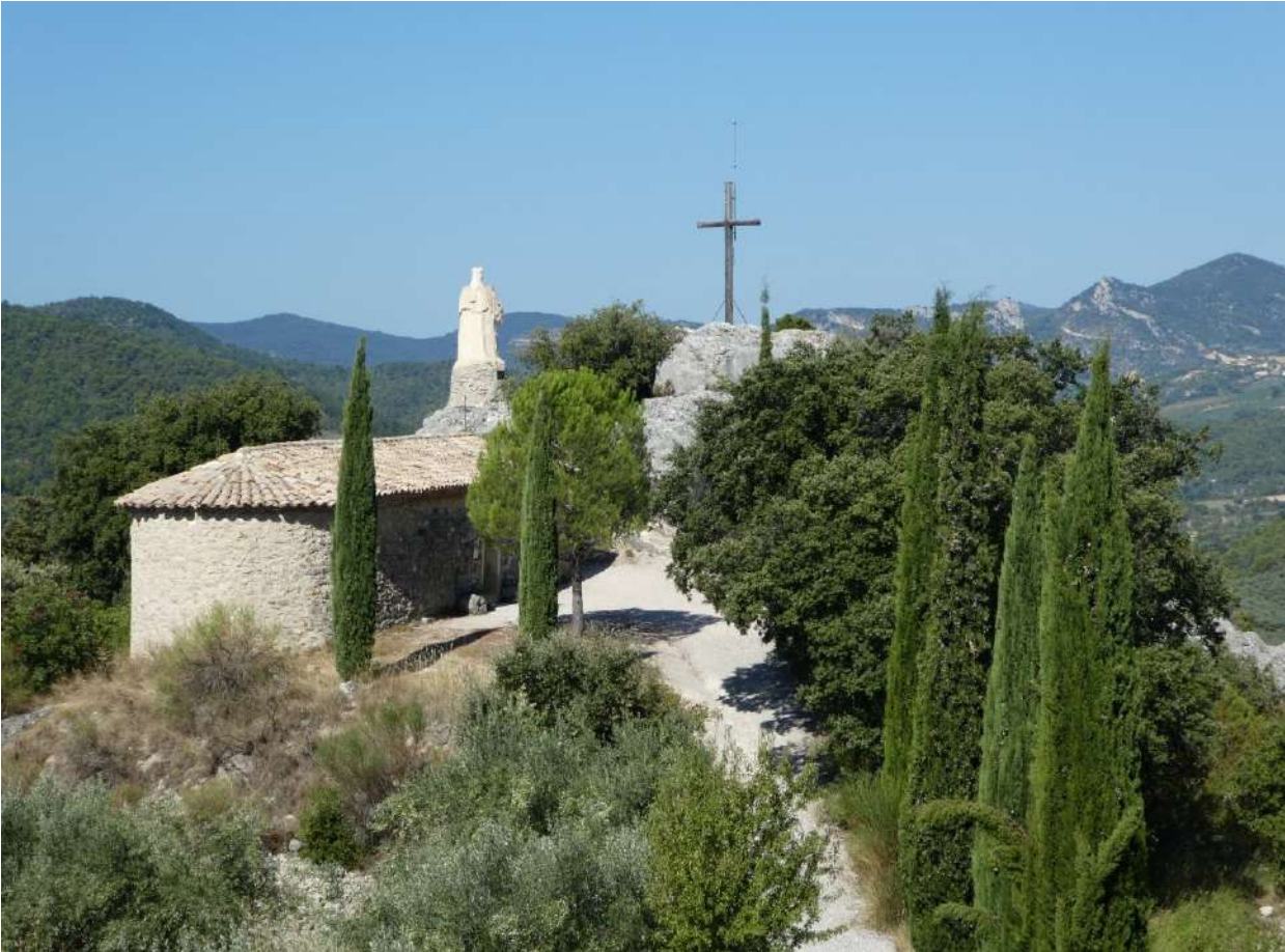
La chapelle Saint-Trophime

La chapelle Saint-Trophime se situe à environ 3 km du Buis, en prenant la route du Saint Julien en direction de La Bouscaude sur l'ancienne route de Plaisians.