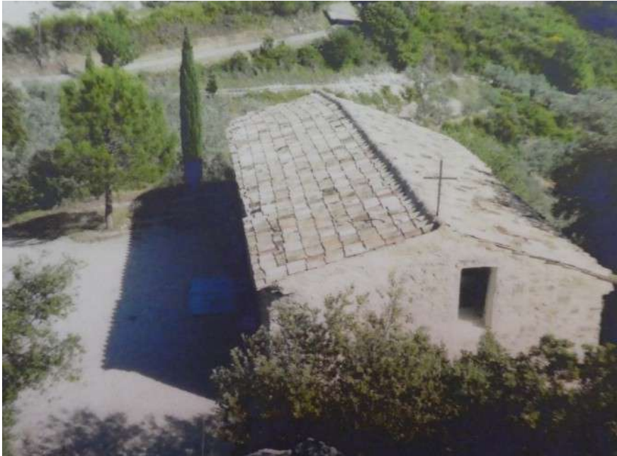
Photo de la chapelle depuis le promontoire de la statue