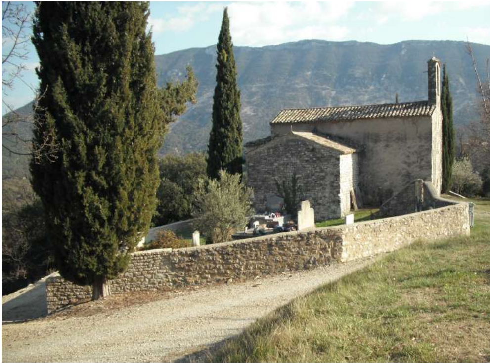
vue coté nord

Photos diverses ( Mireille et Maurice Ravoux, La Penne ) :