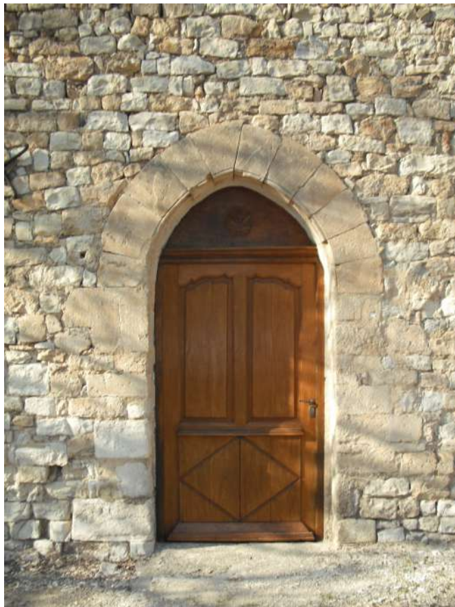
----- entrée coté sud