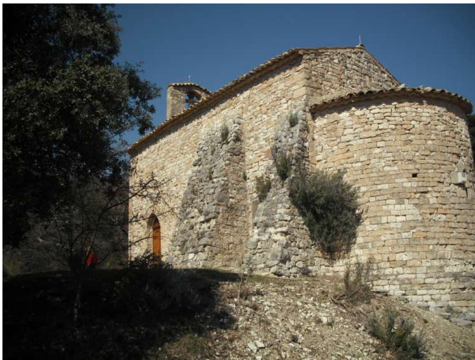
vue coté sud-est