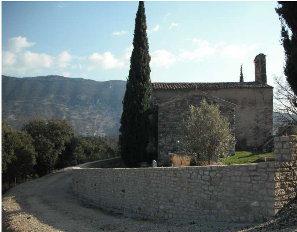
vue coté est