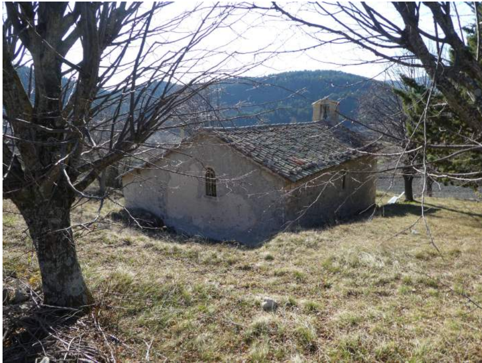
La chapelle vue de l'arrière.

Des inhumations avaient jadis lieu dans un petit cimetière, au milieu des tilleuls. Il ne subsiste aucune sépulture visible de nos jours.