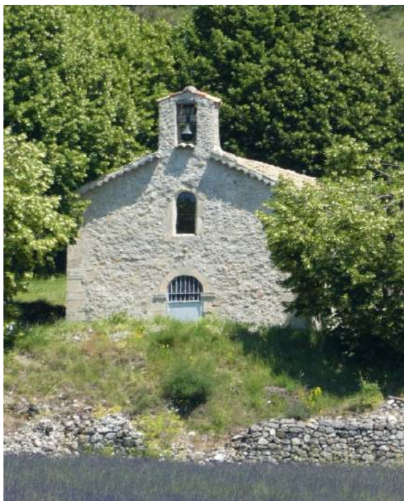
La chapelle Notre-Dame de Barbentane vue du chemin d'accès à l'ouest.

Enfin ce fort devint au Moyen-Âge la forteresse des barons de Mévouillon. La valeur stratégique de cette place est sans aucun doute à l'origine de l'installation sur ce lieu des barons qui régnèrent sur cette contrée jusqu'au XIVe siècle.