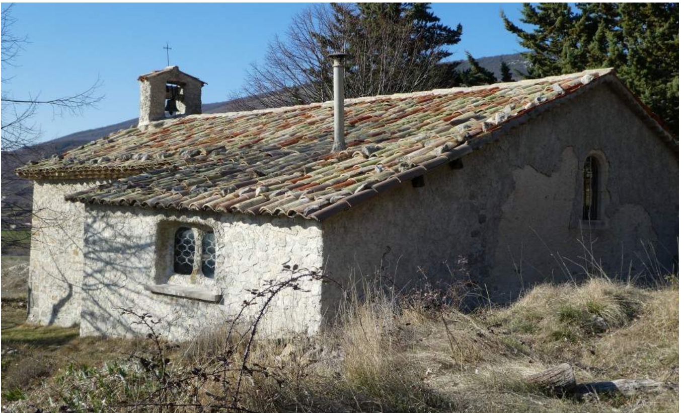
L'ermitage avec sa cheminée sortant du toit est bien visible sur cette photo

Des inhumations avaient jadis lieu dans un petit cimetière, au milieu des tilleuls. Il ne subsiste aucune sépulture visible de nos jours.