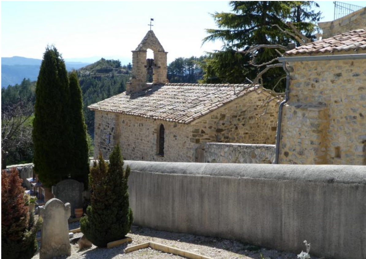
Vue de l'arrière de la chapelle, séparée du cimetière par une ruelle étroite

La chapelle se situe dans le petit hameau de Tarendol, à environ 1 km du village de Bellecombe (voir carte p.4).