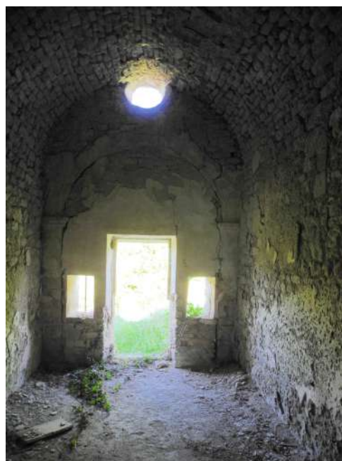
vue de la nef côté est depuis l'autel de l'ancienne église situé à l'ouest