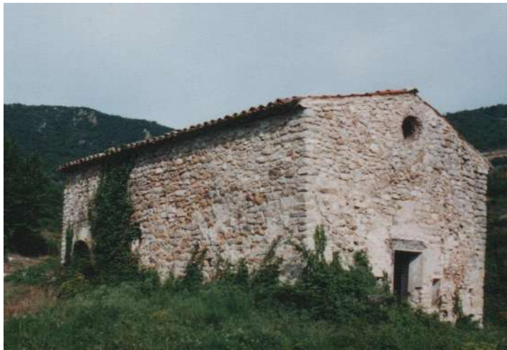
vue extérieure montrant cette ouverture au sud

Porte extradossée, ancien accès au sud ouest du bâtiment ---->