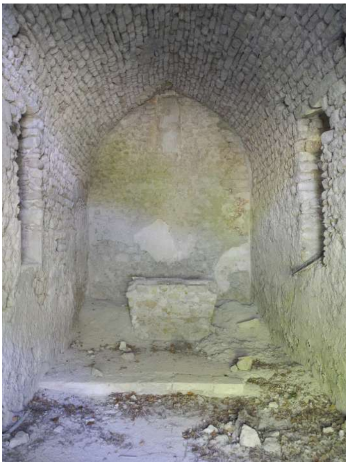
la nef vue depuis la porte actuelle à l'est

L'édifice possédait peut-être une abside à l'origine car la construction a été modifiée côté Est : l'intérieur du bâtiment montre deux colonnes supportant un arc de voûte roman, masqué vers l'extérieur à l'est par le mur actuel percé par la porte actuelle et 2 fenêtres rectangulaires....D'après Michelle Bois, il est probable que cette église était le siège de la paroisse primitive de Benivay. Il est mentionné comme église ruinée (ou désaffectée) dans la Carte de Cassini (fin XVIII e ) où le nom original est déformé en N-D de Piretempli.