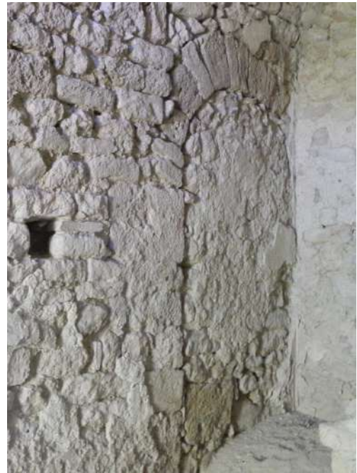
vue intérieure correspondante