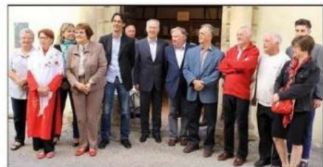
Devant la porte renaissance, les officiels ont inauguré la salle Claude-Bernard qui sert désormais de centre communal de recherches archéologiques.